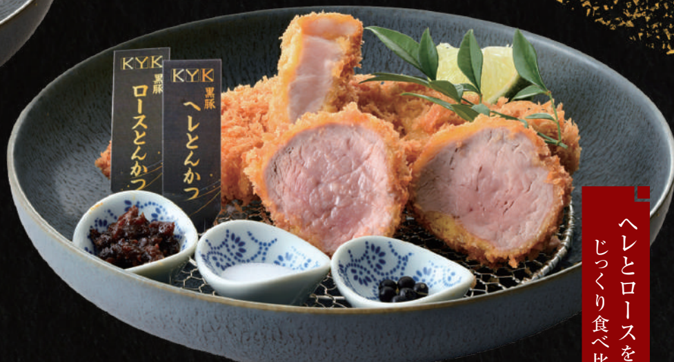
霧島黒豚へれと ロースの合い盛り膳 2,730円

料理内容 黒豚ロースとんかつ (110g) 小鉢2種・小とん汁 (又はお味噌汁) 香の物・ビュッフェ付