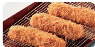
へれとんかつ 1本 (130g) 930円

・国産ロースとんかつ (140g) 1本 1,030円 ・黒豚ロースとんかつ (110g) 1本 1,300円