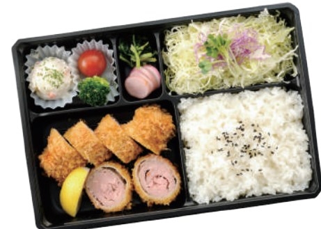
へれとんかつ弁当 1,250円