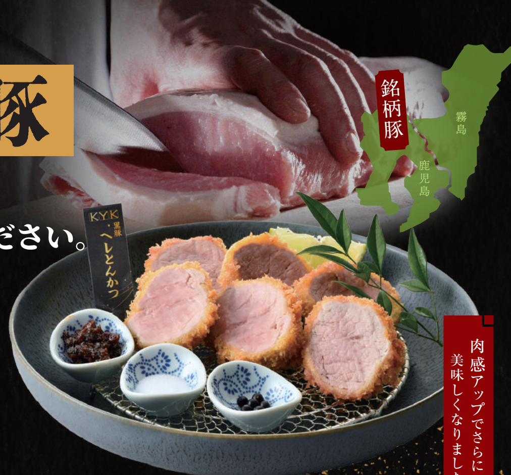
霧島黒豚 へれとんかつ膳 〈120g〉2,680円

仕入れ状況により「霧島黒豚」から「鹿児島黒豚」に変わる場合がございます。 薬味は時季により変わります。