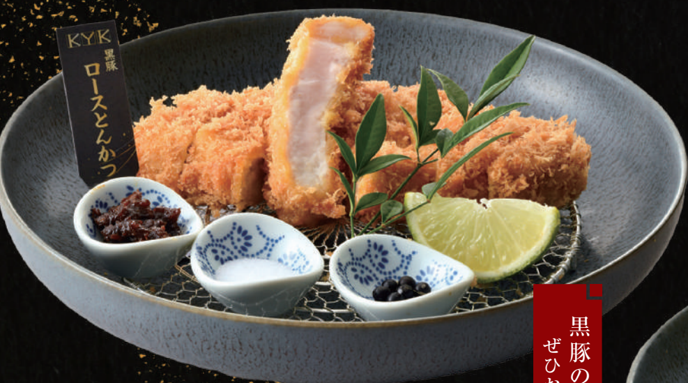
霧島黒豚 ロースとんかつ膳 〈110g〉2,580円

料理内容 黒豚へれとんかつ (40g×3個) 小鉢2種・小とん汁 (又はお味噌汁)・香の物 ビュッフェ付