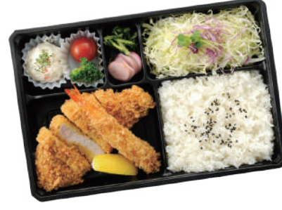
海老フライと国産ロース とんかつ弁当 1,050円