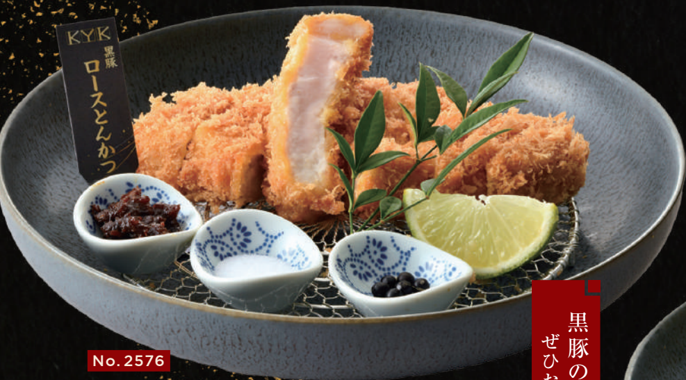
No.2576 鹿児島黒豚 ローズとんかつ膳 〈110g〉2,480円

料理内容 黒豚ヘレとんかつ (40g×3個) キャベツ・小鉢2種・御飯 小とん汁 (又はお味噌汁)・香の物