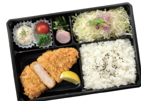
国産ローズとんかつ弁当 1,200円