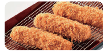
ヘレとんかつ 1本 (130g) 980円

・国産ローズとんかつ (140g) 1枚 1,080円 ・黒豚ローズとんかつ (110g) 1枚 1,350円