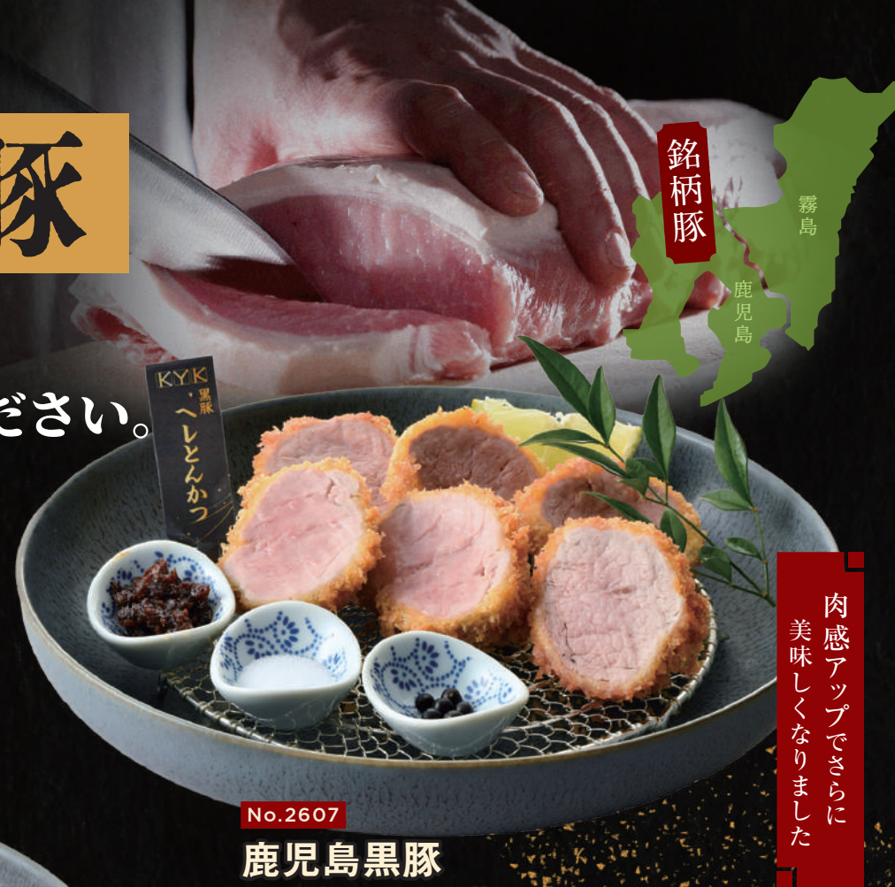
No.2607 鹿児島黒豚 ヘレとんかつ膳 〈120g〉2,580円

仕入れ状況により「鹿児島黒豚」から「霧島黒豚」に変わる場合がございます。 薬味は時季により変わります。