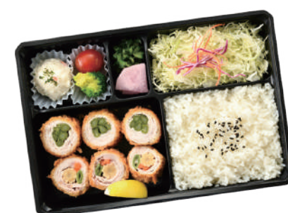
季節の手巻き野菜 とんかつ弁当 1,100円