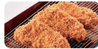
国産ローズとんかつ 1枚 (110g) 900円

・国産ローズとんかつ (140g) 1枚 1,080円 ・黒豚ローズとんかつ (110g) 1枚 1,350円