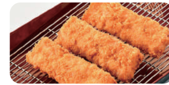
エビかつ 1本 900円

・ヘレとんかつ (90g) 1本 830円 ・黒豚ヘレとんかつ (40g) 1枚 650円