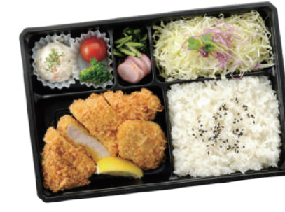
ヘレひとくちと国産ローズの 合い盛り弁当 1,200円